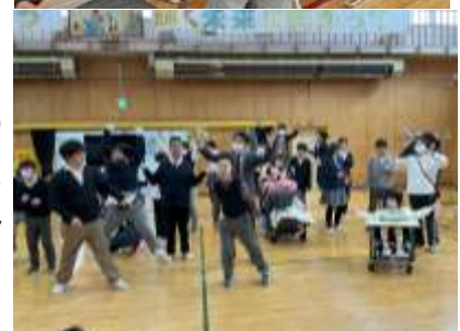
〈中学部 新入生を迎える会〉