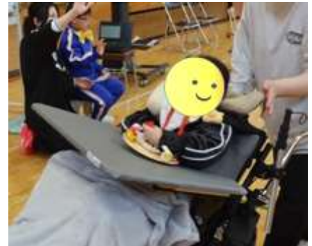
〈小学部 新入生を迎える会〉