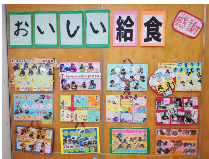
高等部のメッセージボード

また、小学部と中学部の授業では給食室で調理をしている様子をリモート配信し、児童生徒が興味をもって調理現場を見つめる様子が見られました。