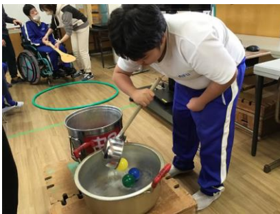
中学部での食育の授業の様子

また、今年度は食堂で調理をしている様子をリモート配信し、大迫力の調理現場に児童生徒が驚く様子が見られました。